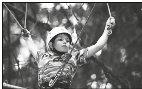
Lanové centrum v korunách stromů