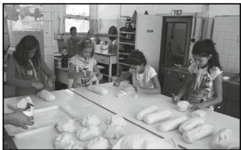
Čerstvé chutné jídlo připravujeme pětkrát denně